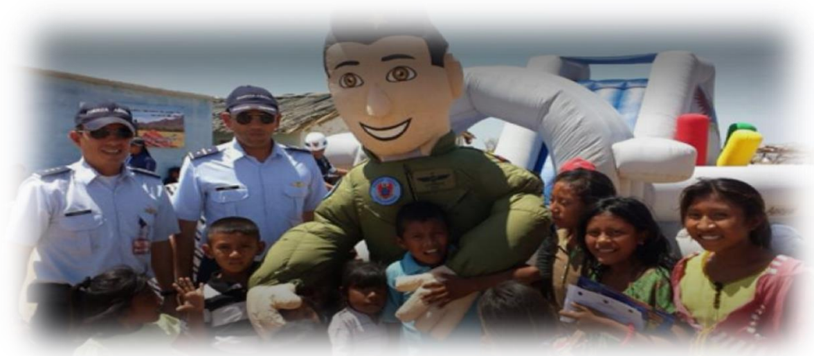
Imagen 1: Actividades con la población civil