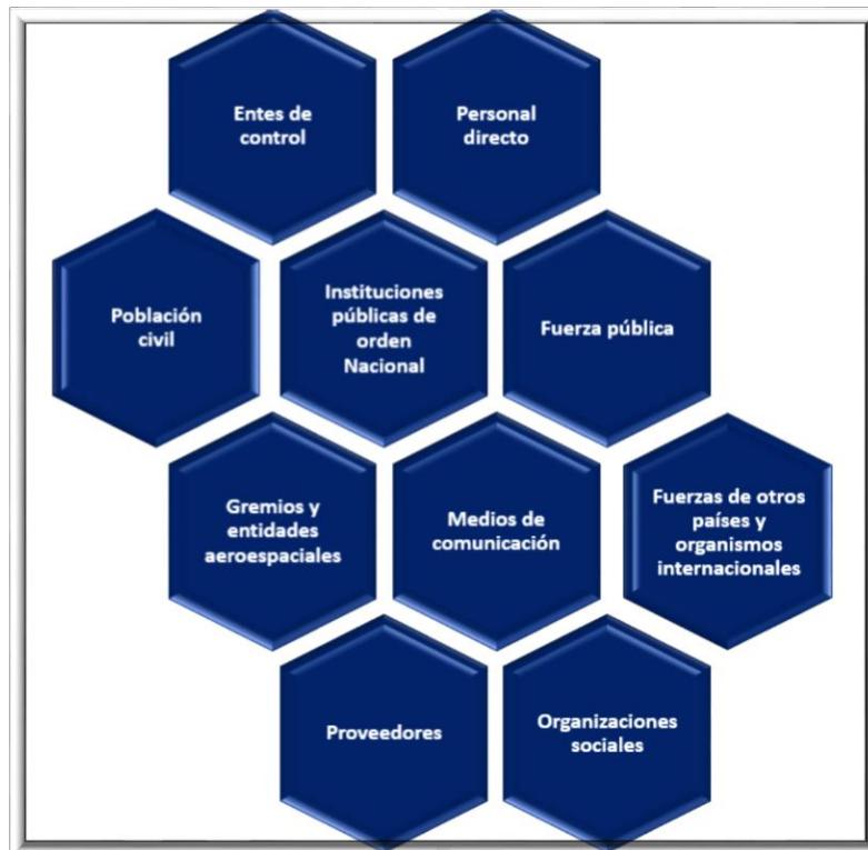
Figura 1: Identificación y caracterización de los grupos de valor FAC