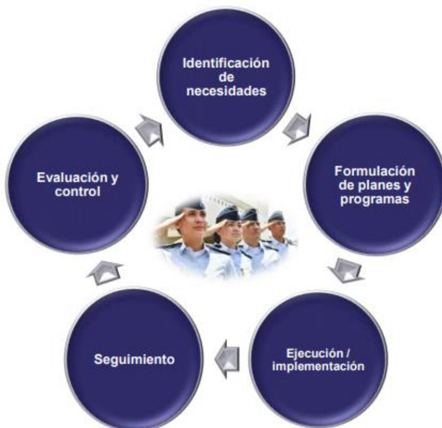
Figura 2: Fases del ciclo de la gestión pública