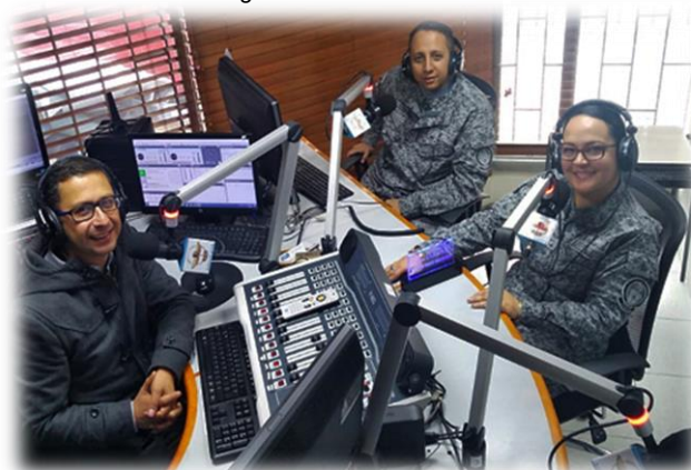
Imagen 3: Emisoras "Al Aire"